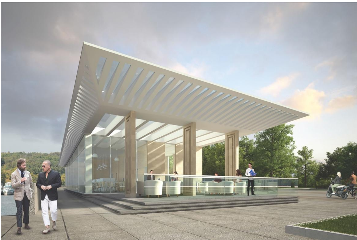
Рис. 1. – Торговый павильон в Лужниках, карниз которого выполнен из стеклопластика [8]

Также повышение огнестойкости полимерных материалов может быть достигнуто путем введения в полимерную матрицу слоистых природных органических глин, монтмориллонита и наночастиц кремнезема (рис. 2) [6]. При содержании всего 3% органоглин в общей массе полимера, пиковое значение скорости тепловыделения снижается более чем на 50%, а временное значение, соответствующее этому пику, сдвигается при содержании 5% наноглины [7]. Однако образцы нанокompозитов часто не обеспечивают должного самозатухания. Для борьбы с этим недостатком было проведено исследование, показавшее, что сочетание наночастиц с традиционными антипиренами (например, вспучивающимися) или их поверхностная обработка эффективно снижают воспламеняемость материала. Полученный материал успешно применяется для производства оболочки кабелей и пластмасс с рейтингом UL94-V.