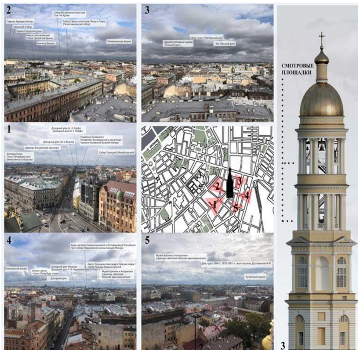
Рис. 2. Пример туристического маршрута с колокольни Владимирского собора. 3D модель колокольни и фотографии - авторская разработка.

Федорова; Храм-часовня Новомученников и Исповедников Российских при Соборе Федоровской иконы Божьей Матери. 5 – музей Арктики и Антарктики (Церковь святителя Николая единоверческая); Дом, где в 1846 г., 1878-1881 гг. жил писатель Достоевский Ф.М.