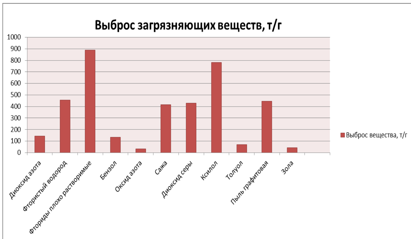
Рис. 1- Перечень некоторых загрязняющих веществ, выбрасываемых в атмосферу

Далее приводятся опасные вещества, загрязняющие атмосферу и обладающие эффектом суммации вредного действия.