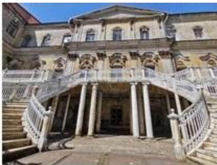
Рис. 3. Металлическая лестница дома-усадьбы [6]

по ней, посетители попадали веранду бельэтажа. Его поддерживала колоннада ионического ордера в цвет лестницы. Особого внимание заслуживает лепной декор на фасаде особняка: существует легенда, что изображенные на барельефах маскароны являются семейными портретами династии Демидовых. Фронтон главного корпуса выходил в сад. В нем были посажены разные сорта яблонь, и организован первый в России кегельбан (кегельная дорожка). Интерьеры усадьбы были созданы под вдохновением от голландской и немецкой архитектуры. Некоторые комнаты отделаны резными панелями из дуба. Среди характерных элементов классицизма: большое количество лепнин и сводчатые потолки. Сейчас особняк Демидовых размещает в себе офисы различных компаний. Усадьбе присвоен статус «памятника архитектуры XVII века». Но, несмотря на это, здание находится в заброшенном состоянии. 15 октября 2022 года в здании усадьбы произошёл пожар [7]. Интерьеры нуждаются в реставрации. Усадьба огорожена высоким забором, из-за чего территорию особняка полностью осмотреть очень сложно. Здание закрыто для входа.