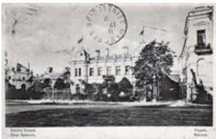
Рис. 2. Фасад старого корпуса особняка Игеля [4]

В 1894 году Эрнест Германович Игель, купец 2-й гильдии, приобрел участок земли. Русский архитектор Анатолий Ковшаров спроектировал на нем каменное здание. Оно было впоследствии переделано в двухэтажный особняк, предназначенный для ресторана французской кухни под названием «Дача Эрнеста». Гости ресторана были выдающиеся люди своего времени — например, писатели Антон Чехов и Максим Горький, президент Франции Феликс Фор [3]. Здание можно отнести к необарокко. Особого внимания заслуживают фасады, на них можно заметить ризалиты, кончающиеся шатрами (рис. 2). Интерьер соответствовал статусу ресторана: были спроектированы высокие окна в главном зале, были спроектированы высокие окна в главном зале,