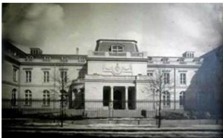
Рис. 5. Фасад дворца Палей в начале века [11]

Первый этаж – парадный, второй предназначен для жилья, а третий – служебный. Хозяева продолжительное время проживали во Франции, вероятно, это определило его внутреннее убранство. Усадьба внешне напоминает Большой Трианон и Компьенский дворец. Мебель была изготовлена под заказ во Франции, в фирме Буланже, на манер Версальского дворца. Здание было крайне современно, так, в нем были спроектированы водопроводная система и электростанция. В 1977 году дворец преобразовали в Пушкинское высшее военное инженерное строительное училище. В советские годы здание было значительно изменено. На месте мансарды появился третий этаж. Лоджии заменили классические портики с треугольным фронтоном, выполненные в русском классицизме. Кроме того, была убрана лепнина. Также была изменена схема внутренней группировки помещений – из традиционной анфиладной на коридорную, в соответствии с нормами проектирования учебных заведений. Территория придворцового сада с оранжереями была реконструирована в плац. С 2010 года там расположена Военная академия тыла и транспорта имени А. В. Хрулева. Сейчас дворец княгини Палей крайне запущен, реставрация не проводится.