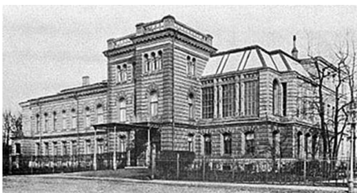
Рис. 1. Фотография особняка Нобеля, 1900-е года [2]

В 1842 году Эммануэль Нобель преуспевал в производстве подводных мин в годы Крымской Войны. Его сын, Людвиг Нобель предусмотрел, как использовать нефть для обогрева и освещения домов и открыл «Механический завод Людвиг Нобель». В 1876 году шведский архитектор Карл Андерсон построил для семьи Людвиг Нобеля особняк на берегу Большой Невки [1]. В 1876 году на Арсенальной набережной появилось двухэтажное красно-желтое здание в стиле модерн (рис.1).