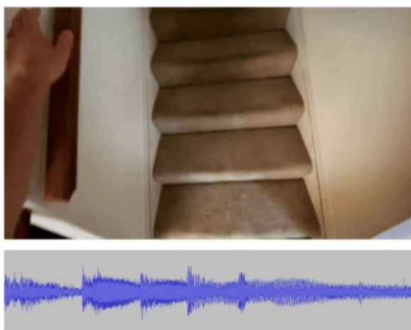
Рис. 1. – Использование языка для построения истории событий на основе видео [2]

Places: staircase. Objects: stairs, animal, mammal, hamster, human leg. Activities: climbing. 5 Possible Sounds: footsteps, creaking stairs, someone calling your name, a dog barking, a centipede crawling.