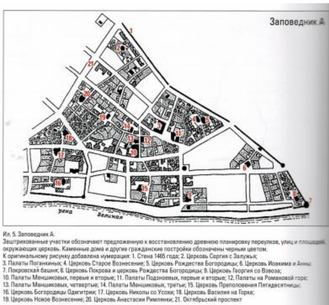
Рис.3. - Архитектурный Заповедник А. [3]

Внимание Спегальского было обращено главным образом на древнерусскую архитектуру [2, 11]. Следует также учитывать переосмысление понятия исторического наследия за прошедшие почти 70 лет. Скорее всего, влияние на решение о постановке ТЭЦ на государственную охрану в 60-х гг. XX в. оказала связь ТЭЦ с событиями Великой Отечественной Войны. Архитектурная ценность, вероятно, была признана позднее, в конце XX в., в период признания ценности конструктивизма. С этим может быть связан выбор участка вблизи комплекса одной из ведущих современных архитектурных мастерских (ООО “Студия 44”) для реализации проекта общественно-жилого комплекса, который