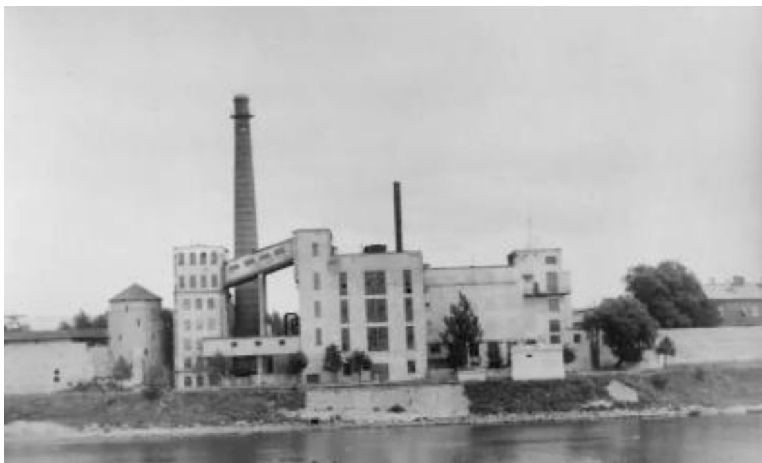
Рис.2. - 1976 год. Мстиславская башня и ТЭЦ. [7]

Исследователь городской среды древних городов А.С. Щенков в ходе изучения ансамблей допускает возможность наличия в составе ансамбля различных по стилю и разновременных элементов [8] в сочетании со структурой ландшафта.