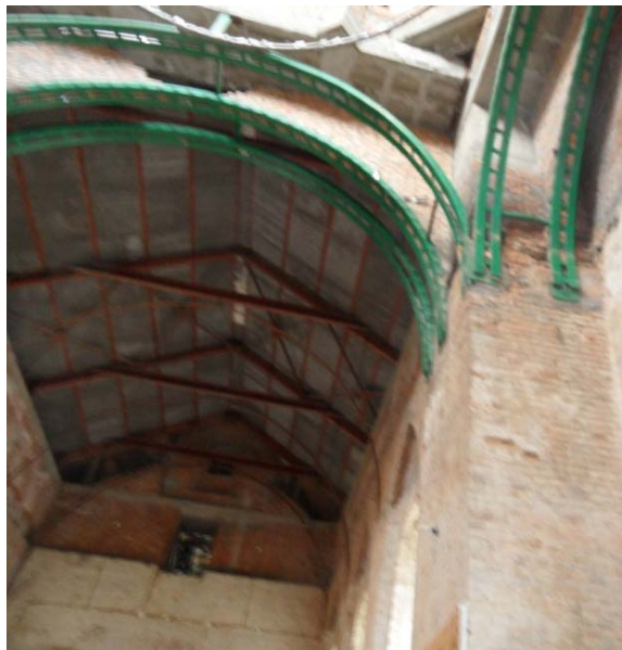
рис.4. Потолок трапезной и подпружные арки

подпружных арок (разрушены в 1958÷60 гг.) невозможно, так как отсутствуют каменщики, умеющие выполнять подобные работы. Для устройства подпружных арок под барабан предусмотрены балки стальные (полуциркульного очертания); арки штукатурные (по сетке на направляющих по полуциркульным балкам) (рис.4.).