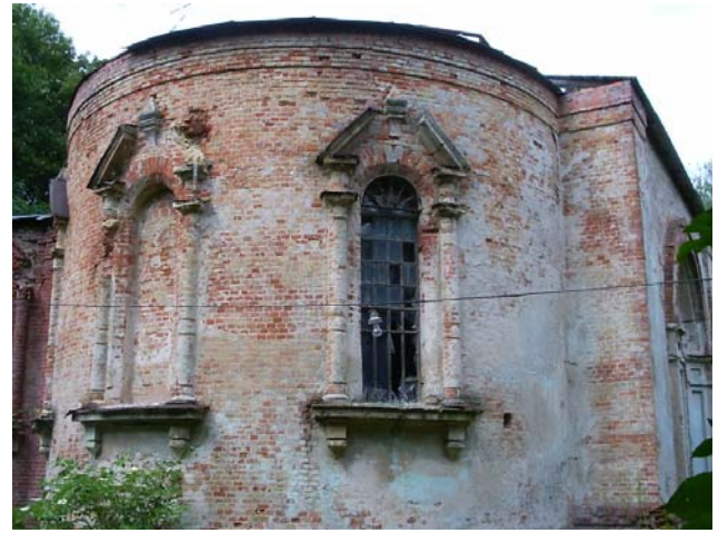
Рис.2. Восточный фасад церкви (2004 г.)

Горизонтальное членение фасадов, подчеркивает венчающий карниз церкви, выложенный из нескольких нависающих друг над другом рядов «поробрика». Окна и фрамуги дверей северного придела снабжены кованными металлическими решетками, ажурного, геометрического рисунка. Частично сохранилось расстекловка оконных проемов. В оконных проемах абсиды выбиты стекла. В ходе восстановительных работ предложено восстановить заполнение оконных проемов с сохранением первоначальной расстекловки и заменой выбитого стекла (рис.3.).