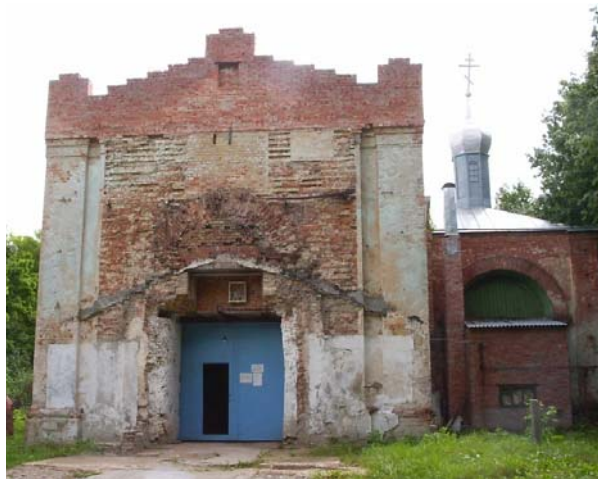
Рис.1. Состояние здания церкви в 2004г. (западный фасад)

фиксируют вертикальные оси простенков между ними. Сверху полуколонны объединены треугольными разомкнутыми сандриками. Оконные проемы и ниши абсиды имеют сходное оформление (рис.2.).