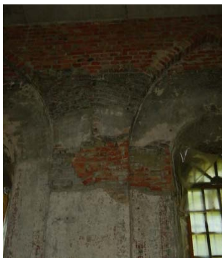
Рис.3. Стены трапезной. Вид изнутри (2004 г.).

Интерьеры выполнялись заново с использованием современных материалов. Внутренняя отделка всех помещений церкви предусмотрена по слою штукатурки. Стены всех помещений оштукатуриваются высококачественной штукатуркой сложным раствором. Верх стен и потолок молельного зала отделяются декоративной штукатуркой типа «венцианская» (по сетке на направляющих по стальным балкам сложного очертания). В отделке интерьеров церкви предусмотрены горизонтальные и арочные тяги, детали из гипса.