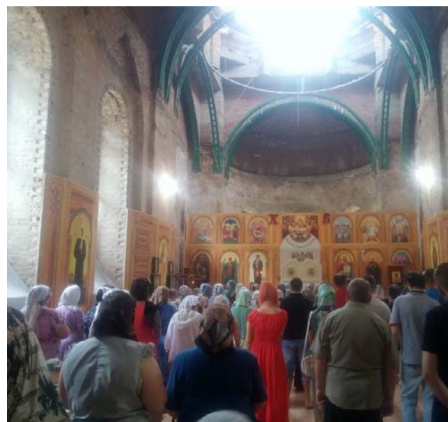
рис.6. Современное состояние интерьеров