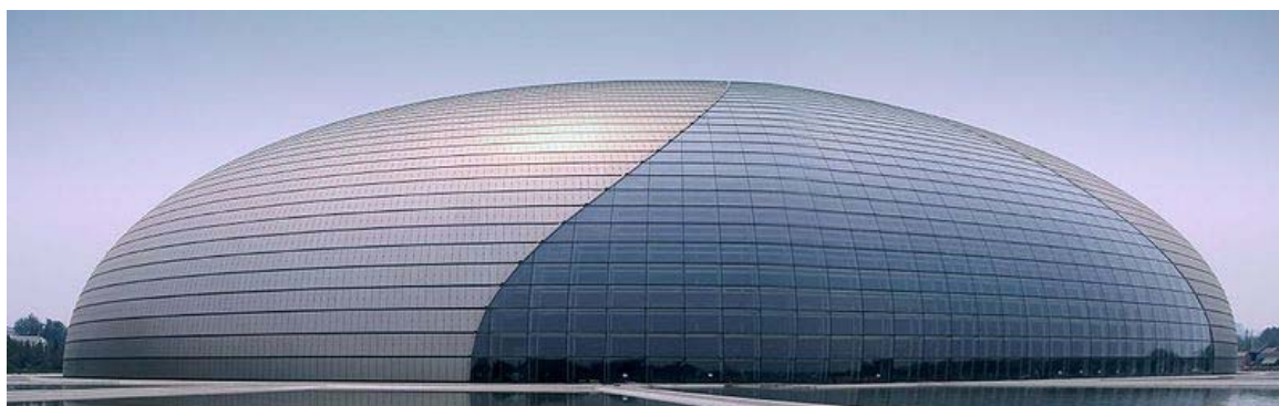
Рис. 2. – Пекинский оперный театр в Китае

Пекинский оперный театр в Китае, построенный в 2007 году, имеет форму, представляющую собой фрагмент эллипсоида – поверхности второго порядка (рис. 2).