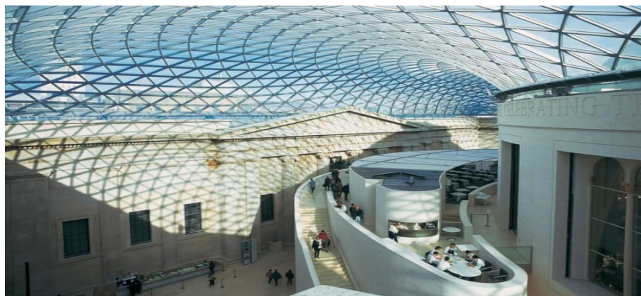
Рис. 3. – Британский музей в Лондоне

Получившаяся оболочка имеет тороподобную форму с радиусом кривизны около 50 метров (рис. 3).