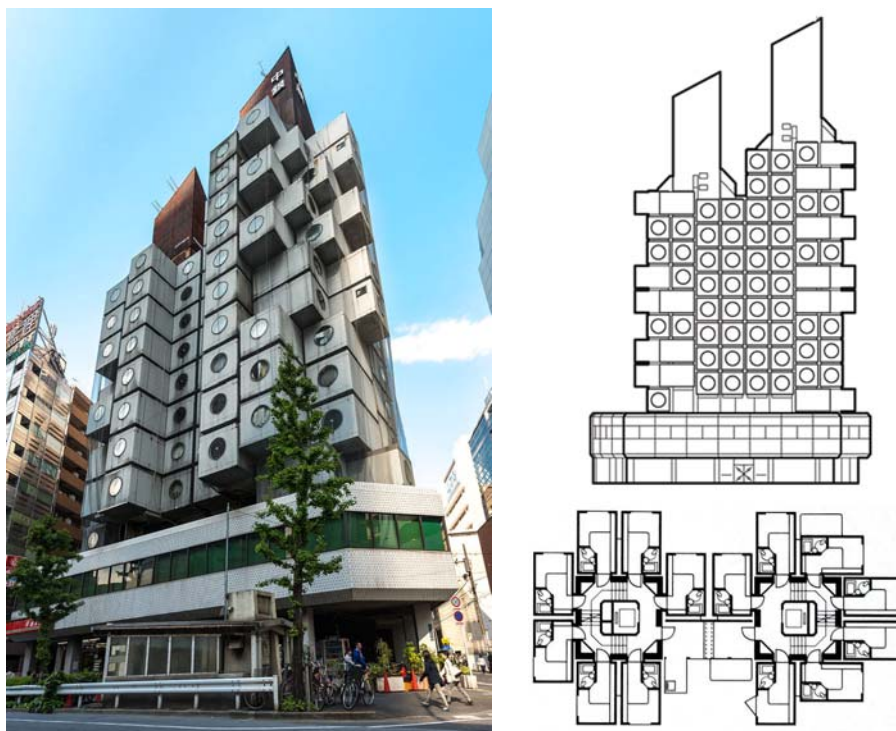
Рис. 2. - Башня «Накагин», арх. К. Курокава

гибкой планировкой – одним из важнейших принципов современной архитектуры и средства трансформации пространства [3].