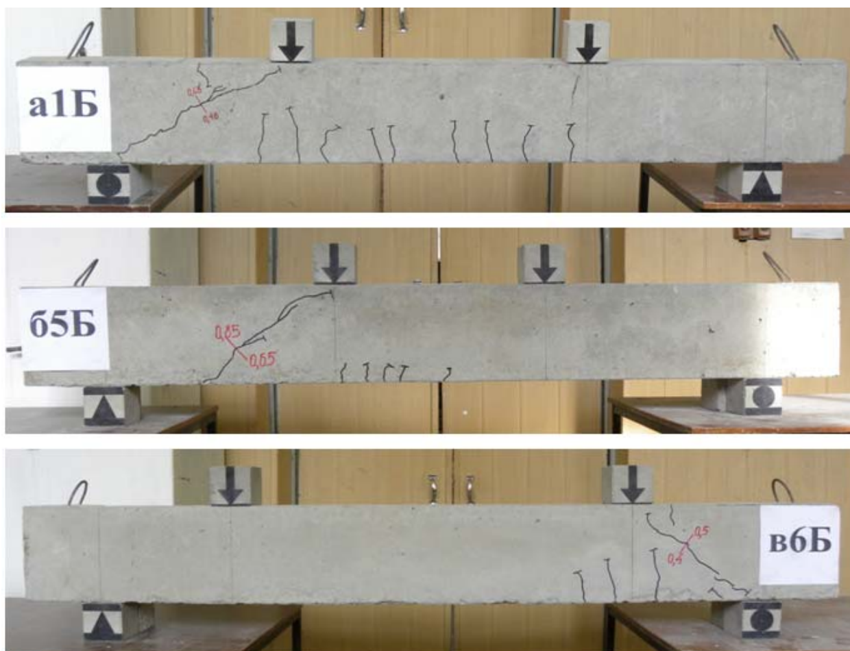
Рис. 2. – Типовой характер развития наклонных трещин испытанных соответственно при пролетах среза, равных 2h_0 (a1Б); 2,5h_0 (65Б) и 1,5h_0 (в6Б).

К изложенному следует добавить и то, что в отдельных балках, испытанных при a=1,5h_0 , наклонная трещина пересекла рабочую арматуру у грани опоры и продолжала в дальнейшем свое развитие вдоль арматуры, нарушая тем самым сцепление с бетоном. Проводимые ранее одним из авторов опыты с арматурой класса А400, такую картину развития наклонных трещин не показывали. Этот фактор особо важен, если иметь ввиду то, что СП 63.13330.2012г. рекомендует использовать арматуру классов А500 и А600 в качестве рабочей и для обычных конструкций, т. е. не имеющих преднапряжения.