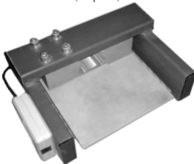
Рисунок 1. Внешний вид датчика

С 2011 г. в ОКБ «РИТМ» приступили к разработке специального комплекса для комфортного контроля лежащих тяжелобольных. В рамках НИР в интересах ОКБ в научно-исследовательском институте нейрокибернетики им. А.Б. Когана (г. Ростов-на-Дону) были разработаны и изготовлены экспериментальные образцы четырех тензометрических датчиков силы оригинальной конструкции под руководством старшего научного сотрудника Кривца Д. В. Особенностью датчика является нечувствительность к точке приложения силы, а так же малая высота расположения силовводящей поверхности, размер которой составляет 165x110мм. (см. рис. 1)